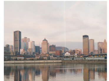
Ville de Montréal

La Chaire associe au développement de la recherche des personnes et des organismes impliqués dans l'action communautaire et des responsables du réseau de la santé et du secteur municipal qui ont une