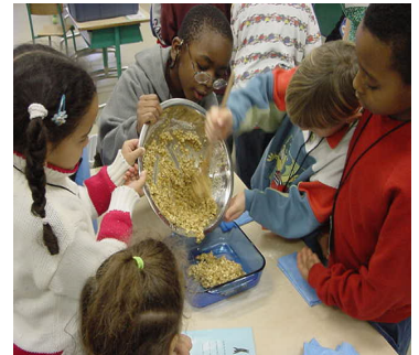
Un atelier de Petits cuistots à l'école De la Petite Bourgogne

Un comité aviseur à l'évaluation a été formé et se réunit régulièrement depuis septembre 2002. Ce comité comprend des représentantes de tous les organismes de soutien, la directrice et le directeur administratif du projet, deux chercheuses provenant des équipes de recherche associées dans l'évaluation. L'intérêt et le dynamisme qui s'est développé en peu de temps dans ce partenariat démontre la pertinence d'une telle démarche. Celle-ci est essentielle pour documenter le projet, mais surtout, pour soutenir son développement et sa dissémination en arrimage avec les programmes scolaires. Ce précieux partenariat permettra également d'identifier les conditions favorables ou défavorables à la réalisation du projet, et de faire des ajustements, si nécessaire, afin que le projet évolue vers les résultats visés.